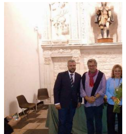
( http://www.ragusah24.it/wp-content/uploads/2017/10/22497458_1021259089980 )