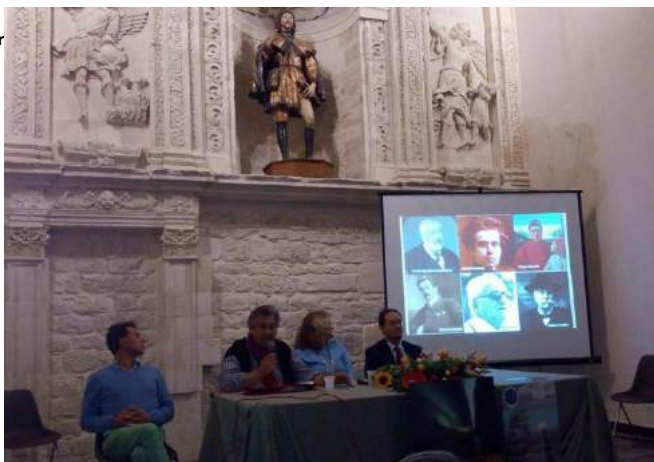
( http://www.ragusah24.it/wp-content/uploads/2017/10/22472442_10212590900561014_2079903561_n.jpg )